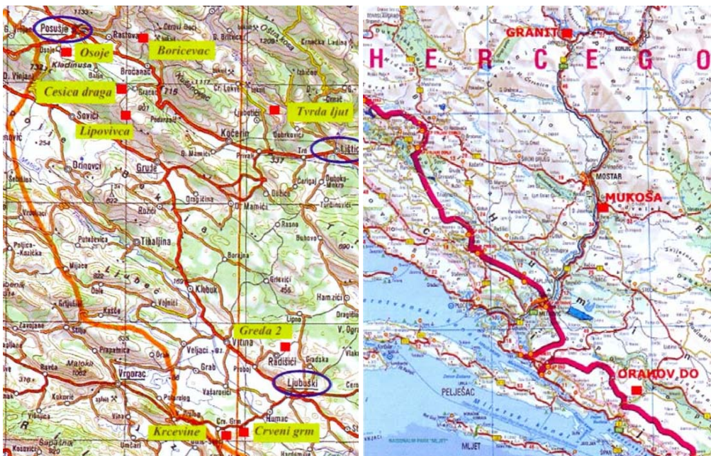
Slike 1.-2. Aktivni kamenolomi na području ŽZH (lijevo) i HNŽ/K (desno);